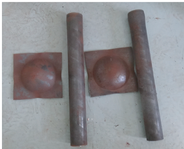
图3 隔板试验Ⅱ测试结果 Fig.3 Test result of diaphragm test II