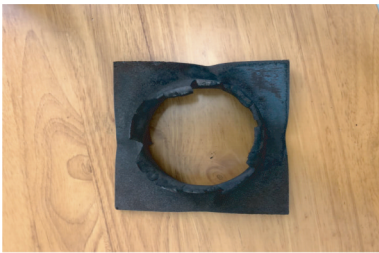
图 2 隔板试验 I 测试结果

根据联合国危险品分类标准和试验方法,如果试验样品在隔板试验 I、克南试验 I 以及时间/压力试验 I 3 种试验中的任一试验结果为“+”,即可说明此激发管药剂具有爆炸性。因此该药剂样品具有爆炸性。