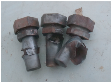
图4 克南实验Ⅱ试验结果 Fig.4 Test result of Koenen test II

本试验用于确定自制炸药在封闭条件下点火的效应,以便确定自制炸药在正常包件中可能达到的压力下点火是否导致具有爆炸猛烈性的爆燃。